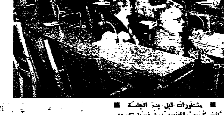
مشروبات قبل بدء الجلسة